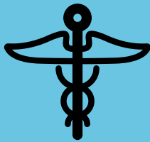
Image provenant des archives du Women's College Hospital, adaptée par nineSixteen Creative